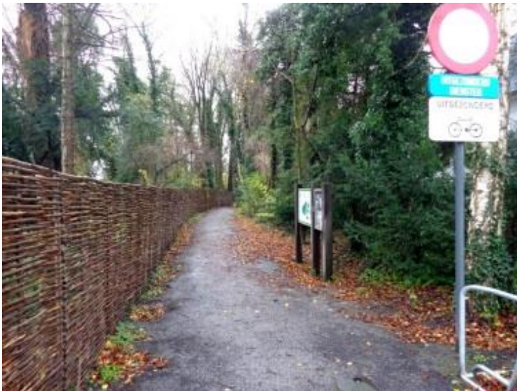
Figuur 4 toegang tot het Natuurpark Overmeers vanuit Sint-Denijslaan

De onderstaande figuur geeft een overzicht van de belangrijkste trage wegen in de buurt.