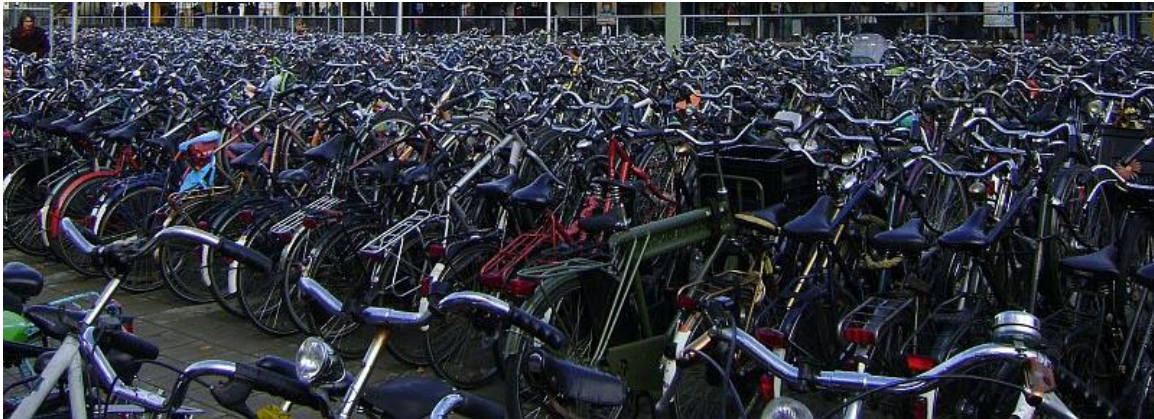
Figuur 6 foto van fietsenstallingen op Mathildeplein

Zes jaar later is het terrein dat hierdoor werd gecreëerd deels in gebruik als fietsenstalling, deels ontoegankelijk en in gebruik als werfzone. Het geheel oogt chaotisch en onverzorgd, treinreizigers die het station aan de achterkant verlaten worden door middel van omwegen doorheen de werfzone geloodst... er is heel wat fantasie nodig om hierin een kwalitatief plein te ontdekken.