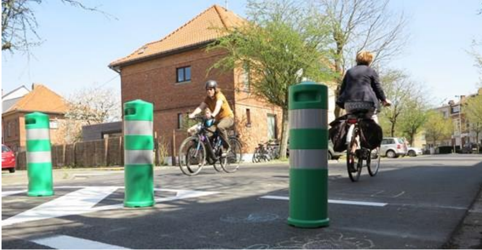
Figuur 1 foto van paaltjes in de Tuinwijklaan, 2015