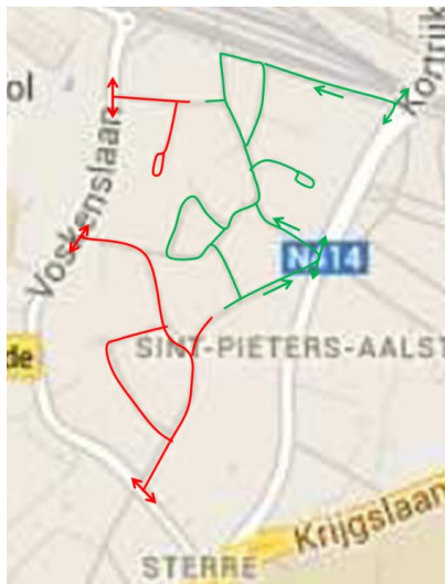
Figuur 2 oorspronkelijk voorstel circulatie begin 2015