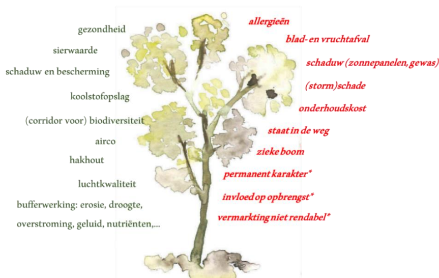
Figuur 1: Redenen om bomen buiten bosverband aan te planten of te behouden (links) en motieven om te kappen of niet aan te planten (rechts). * specifieke motieven van landbouwers om bomen niet aan te planten.

aan dat het motief vermeld in de vergunningsaanvraag niet altijd de werkelijke reden is. Zo zijn ‘zieke’ bomen soms niet echt ziek en is de aanleiding voor de kap in realiteit bijvoorbeeld de bouw van een zwembad. Gelijkaardige bezwaren kwamen naar voren bij een bevraging van groenambtenaren in Nederland (Wolthuis et al. 2007). Bij landbouwers leeft de angst voor opbrengstverliezen of staat de boom in de weg tijdens het bewerken van de velden. Specifieke bezwaren tegen het aanplanten van houtige kleine landschapselementen zijn bij hen ook de vrees voor hun permanent karakter, eens aangeplant. De onderhoudskost of moeilijke vermarkting van snoeihout spelen ook mee (Figuur 1).